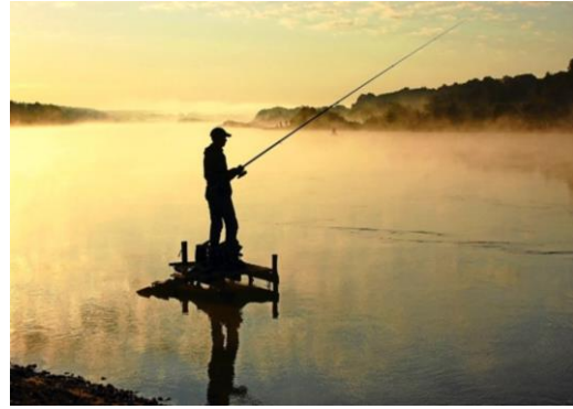
4. der Großvater