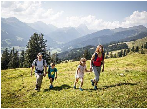
3. die Familie